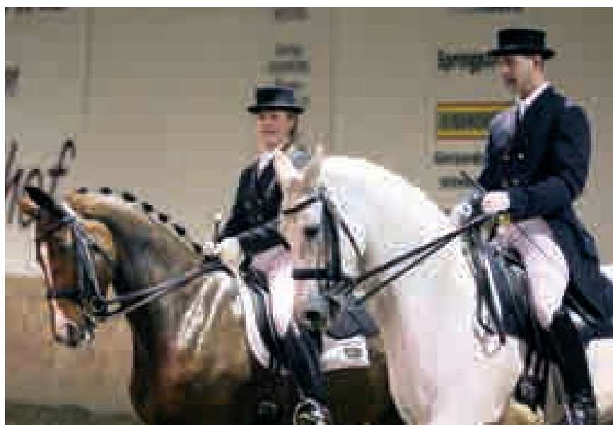
Uniek in het Belgische dressuurlandschap is dat man en vrouw samen starten op dezelfde internationale wedstrijden.